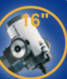
LX200ACF ohne Stativ / Säule: