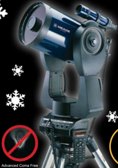
Advanced Coma Free